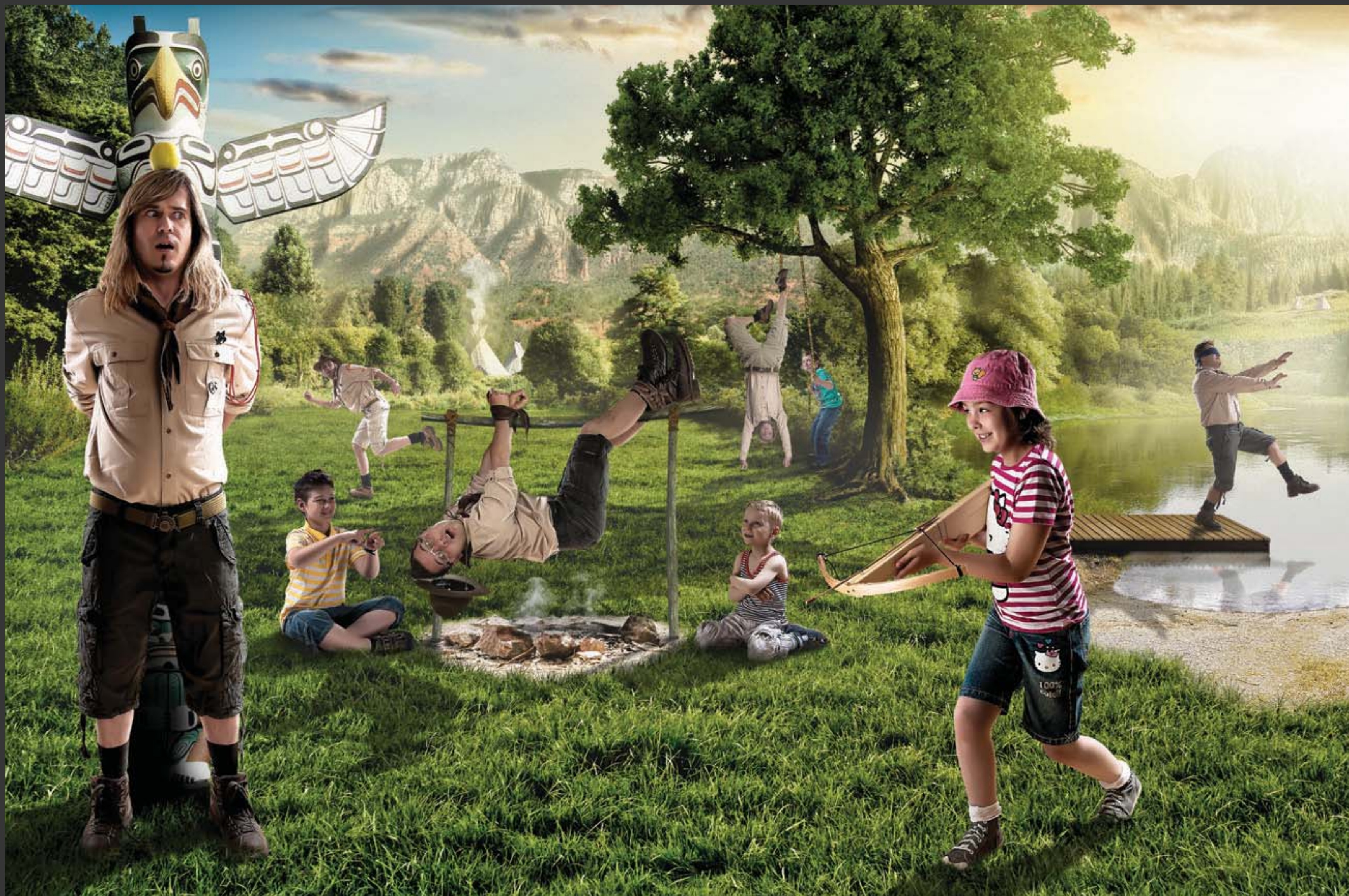
Argema – hudební skupina