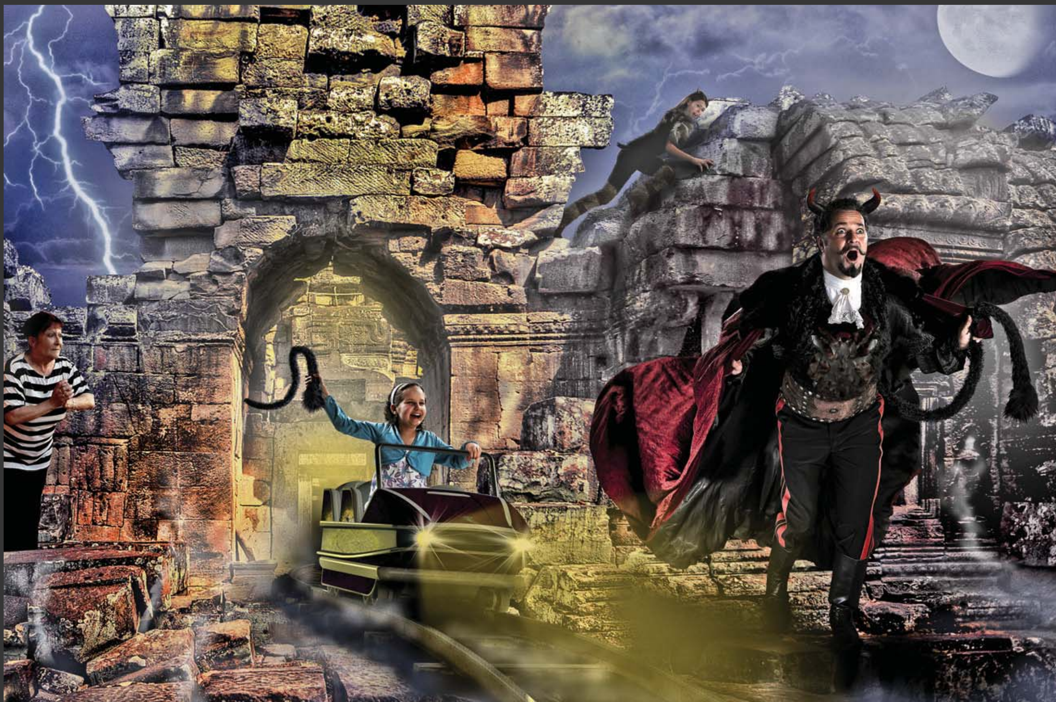
Martin Dejdar – herec, moderátor a zpěvák