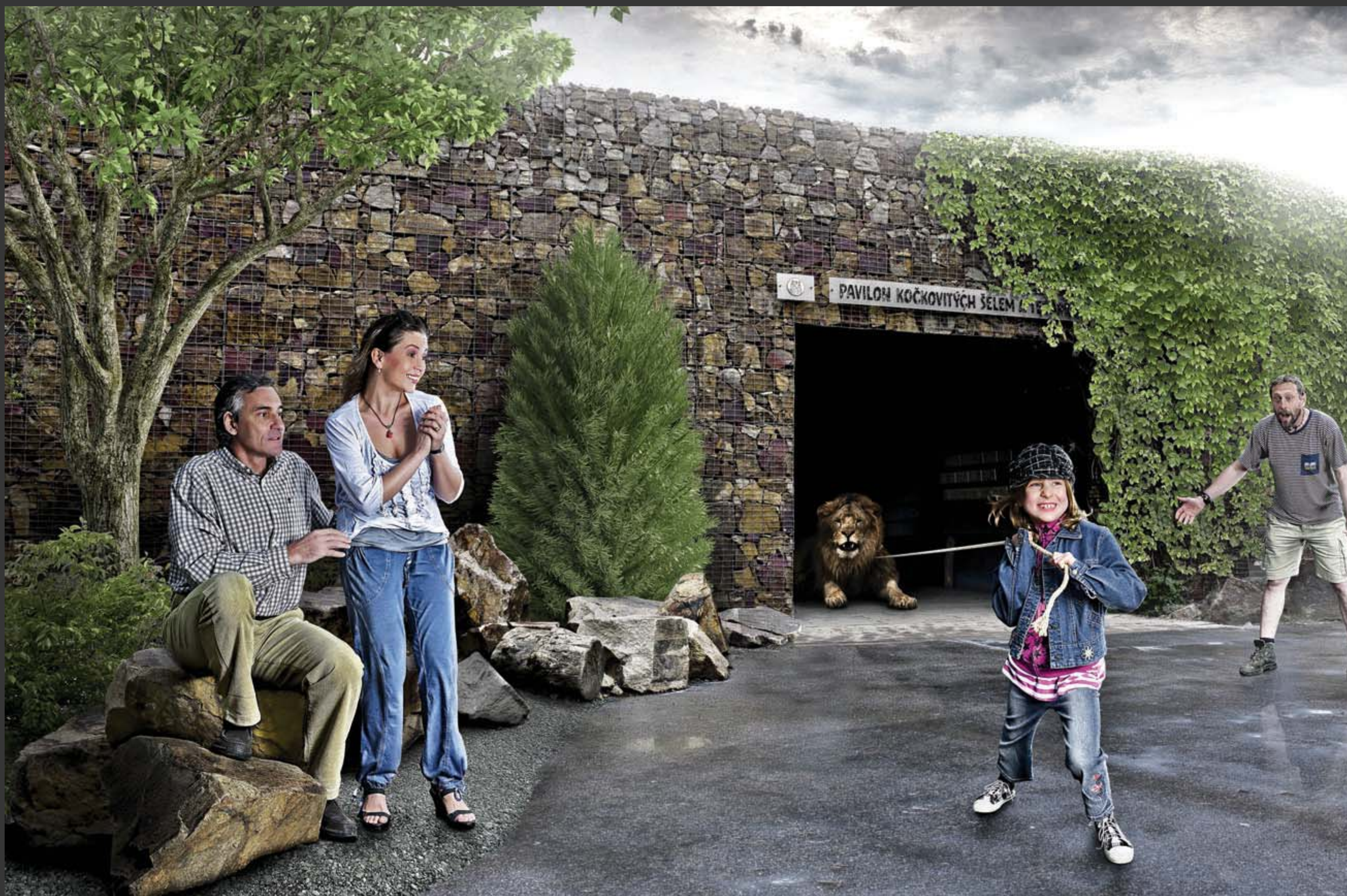
Dana Morávková – herečka a moderátorka, Jan Čenský – herec