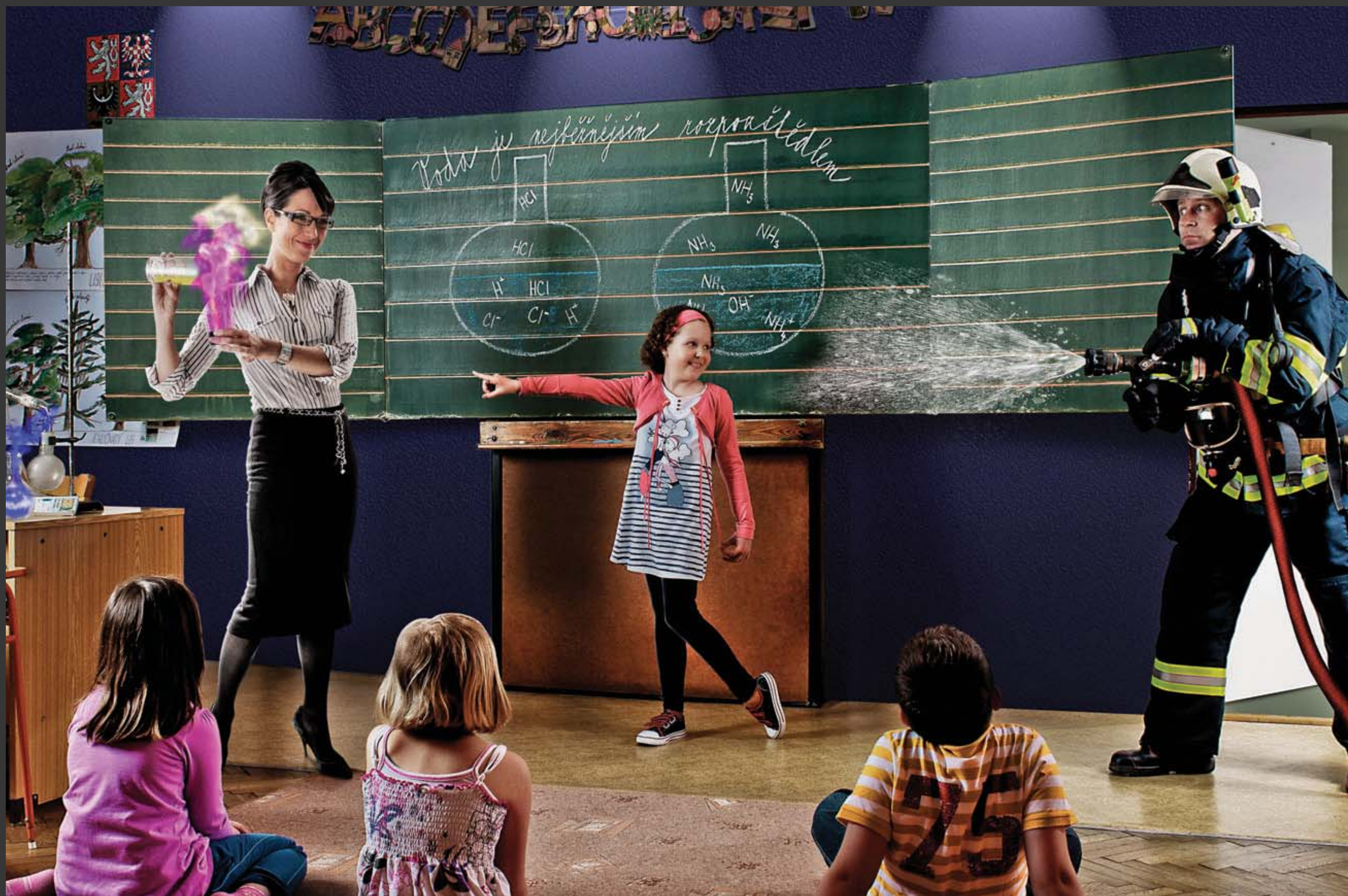
Tereza Kostková – herečka a moderátorka